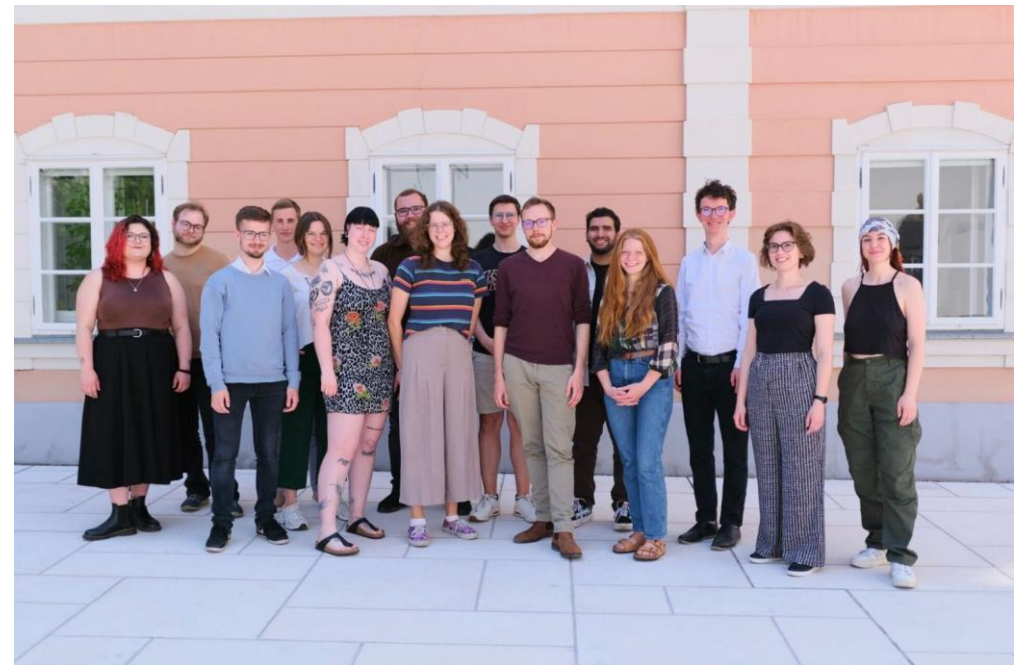
Universitätsvertretung ÖH Uni Salzburg, Juli 2023

vielseitige Aktivitäten für euer studentisches Leben. Das und noch vieles mehr ist die ÖH für euch. Hier im Study Guide findet ihr einen ersten Überblick über unsere Services, Informationen zur ÖH als Institution, unsere Kontaktdaten und hilfreiche Tipps für euer Studium.